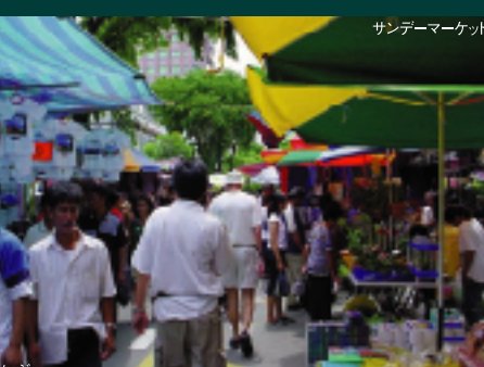
サンデーマーケット 毎週日曜の朝、ガヤストリートで開催されるサンデーマーケット(朝市)。地方からの品物が集まるので、準備は前日深夜から始まることも。全長約110メートルにわたり、色々な屋台が立ち並びます。新鮮な果物や野菜に始まり、えびやホタテの乾物、生活用品などなど、活気に溢れています。ローカルもお買い物に来る位、お値段は保障済み。マンゴー、パパイヤ、マンゴスチン、ランブータンなど果物の買い過ぎにご注意!コタキナバルの活気を肌で感じてください。