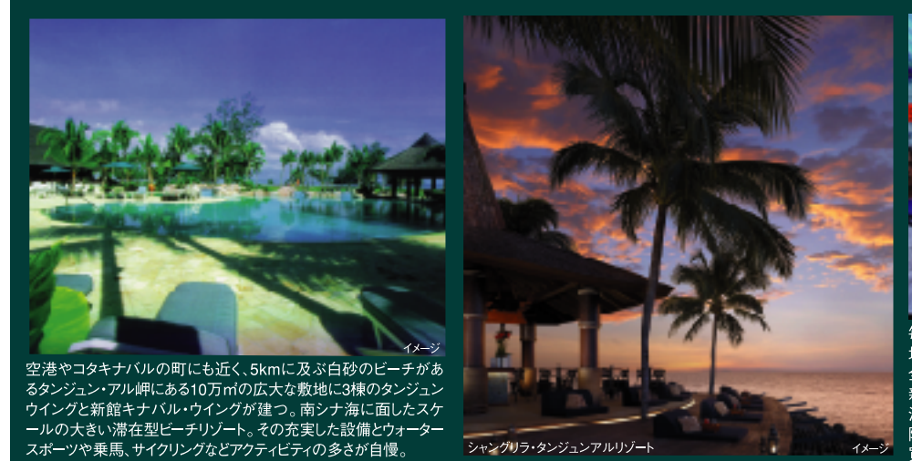
イメージ 空港やコタキナバルの町にも近く、5kmに及ぶ白砂のビーチがあるタンジュン・アル岬にある10万㎡の広大な敷地に3棟のタンジュンウイングと新館キナバル・ウイングが建つ。南シナ海に面したスケールの大きい滞在型ビーチリゾート。その充実した設備とウォータースポーツや乗馬、サイクリングなどアクティビティの多さが自慢。