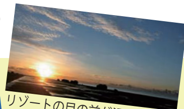
リゾートの目の前が滑走路です!