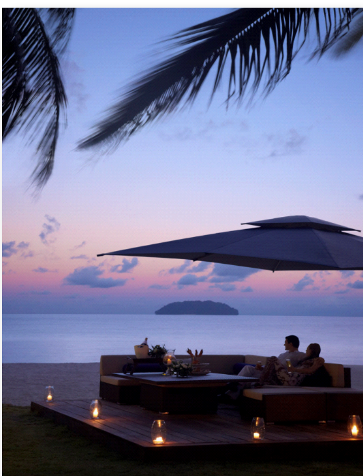
右：南シナ海に沈みゆく夕日を見ながら、ロマンチックなひとときを。