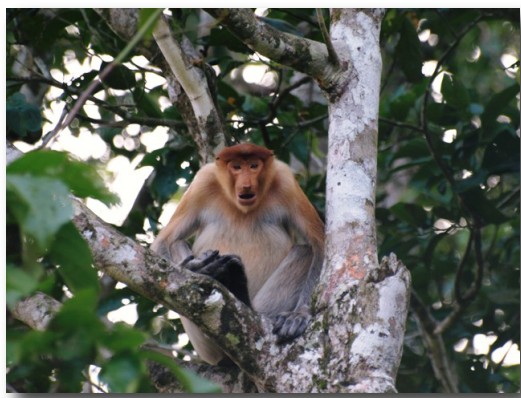
上：ボルネオ島でしか見られない、大きな鼻が特徴のテングザル。