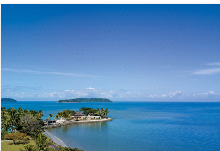
上：シャングリラ・タンジュン・アル・リゾート&スパ 美しい海と青い空を満喫。