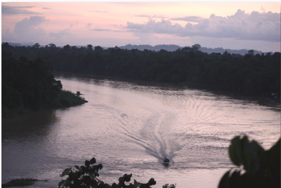
右：スカウリゾートは全5棟でプライベート感抜群。全てのお部屋のテラスから雄大な流れを望む。